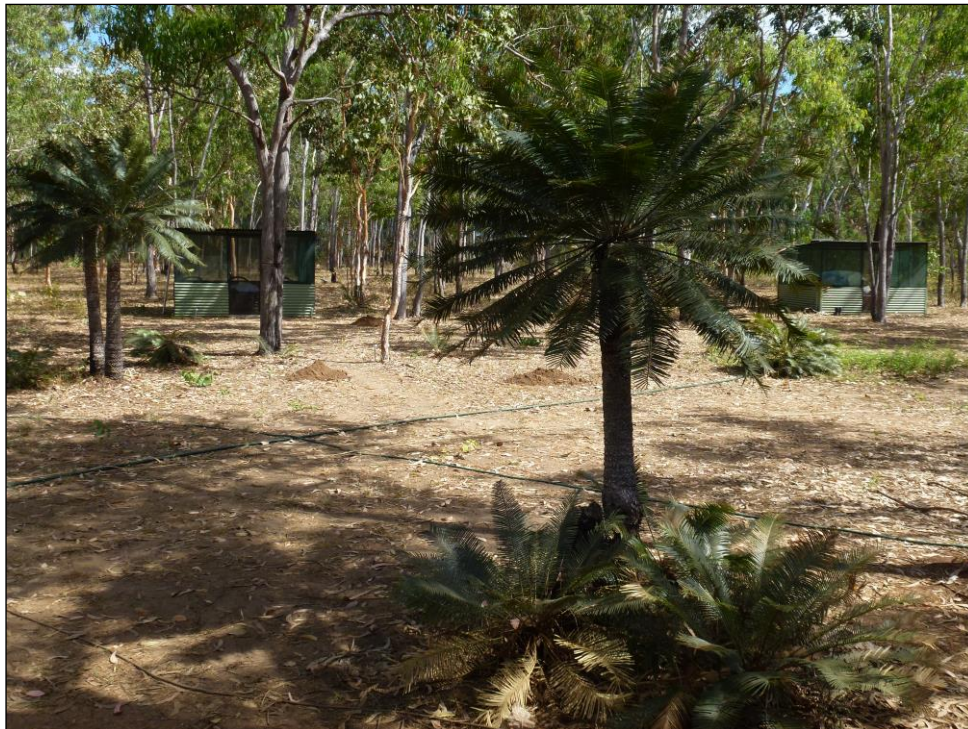
„Typisches Jagdcamp in der Wildnis der Northern Territories!“