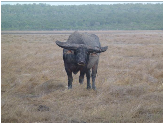
„Auge in Auge mit dem tonnenschweren Koloss!“