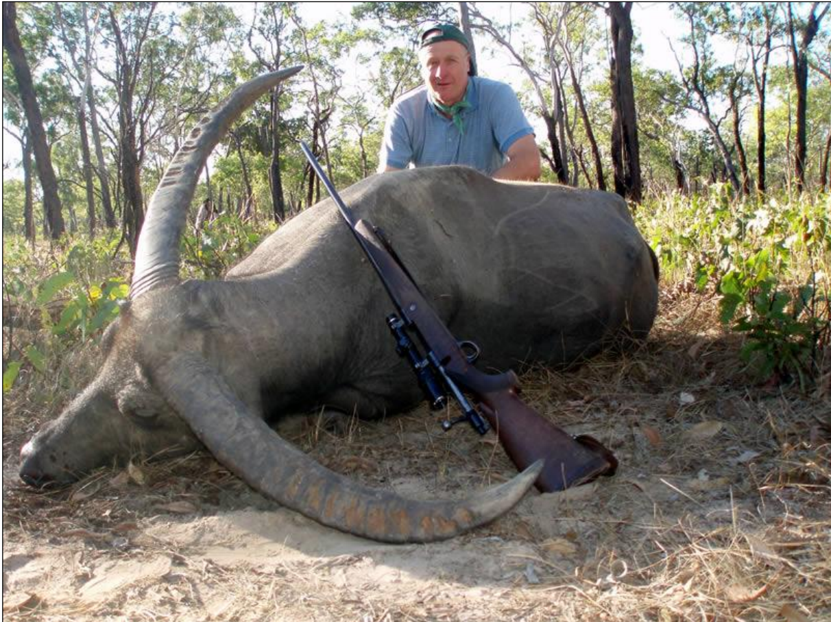
„Für diesen Brocken lohnt sich die weite Reise!“

Unser Outfitter ist einer der größten Jagdveranstalter Australiens. Er veranstaltet Jagden auf die wehrhaften Wasserbüffel und Keiler, sowie als besondere Rarität auch auf den seltenen Banteng. Auf Wunsch arbeitet er Ihnen auch nach der Jagd ein Nebenprogramm aus. Teilen Sie uns Ihre Wünsche mit, wir erfüllen Sie gerne! Nachfolgend stellt er Ihnen einige seiner besten Jagdangebote vor.