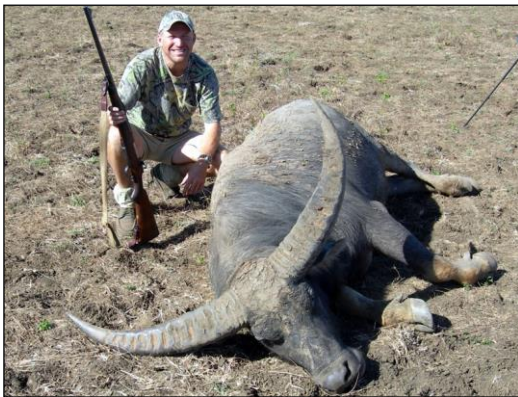
„Nach anstrengender Fußpirsch, auf kurze Entfernung über Kimme und Korn erlegt!“

Es besteht aber auch die Möglichkeit über das Flugreisebüro ein ETA - Elektronisches Visum für Besucher und Touristen zu beantragen.