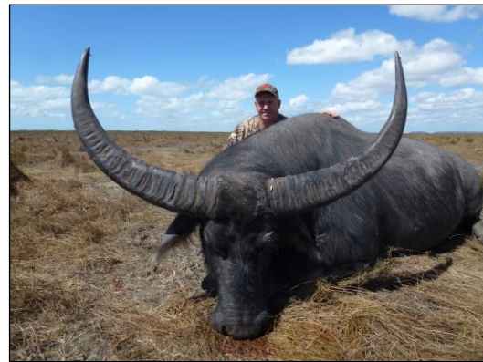
„Ein echtes Prachtexemplar!“

2) Für Australien sind derzeit keine Impfungen vorgeschrieben.