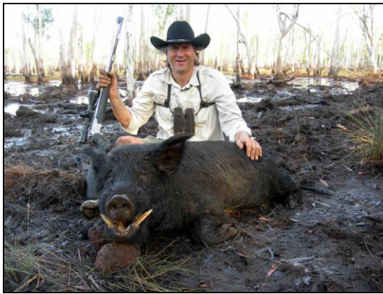
„Eine Kombination mit Keiler ist immer möglich!“

Weitere Informationen sowie detaillierte Angebote auf Anfrage! (Auch Flugangebote, evtl. Visum, Hilfe bei Waffen- und Trophäeneinfuhr) Kontaktieren Sie uns!