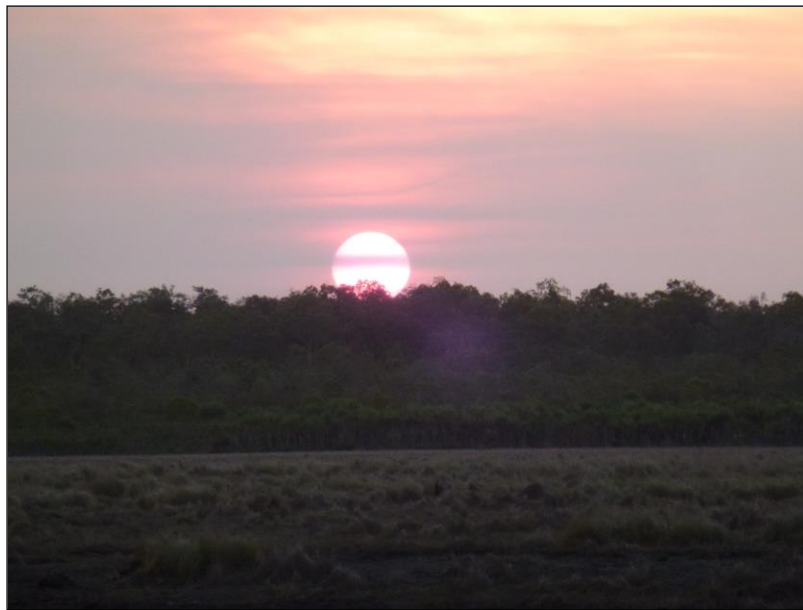
„Sonnenuntergang im Arnhemland!“