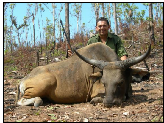
„Der Banteng - eine seltene Rarität aus Südostasien!“