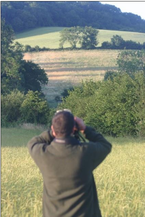
„Erst Abglasen, dann anpirschen!“

Weitere Informationen sowie detaillierte Angebote auf Anfrage! (Auch Flugangebote, evtl. Visum, Hilfe bei Waffen- und Trophäeneinfuhr) Kontaktieren Sie uns!