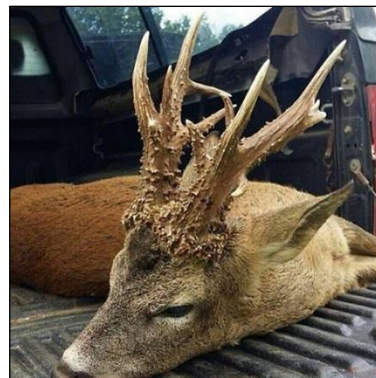
„Südenglische Böcke der Spitzenklasse!“