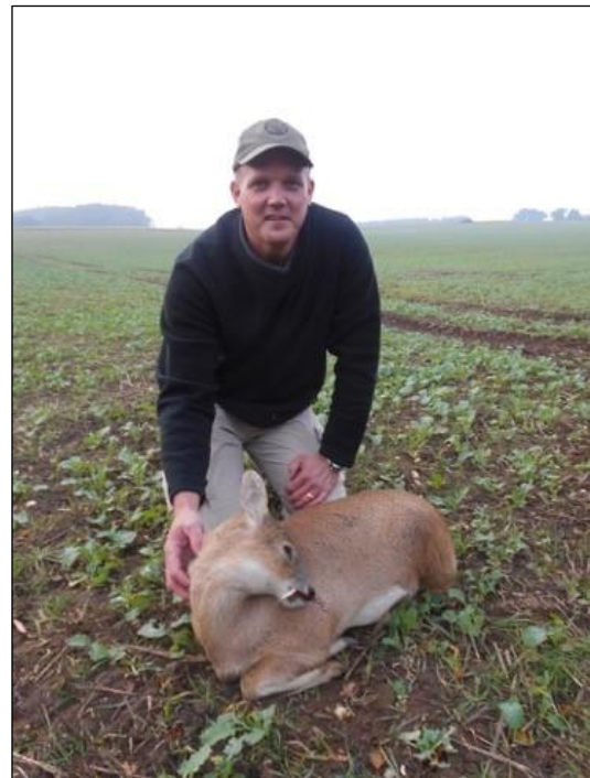
„Seltene Trophäe aus Ostasien! Selbst dort rar geworden!“