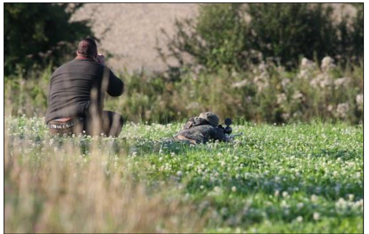
„Anspruchsvolle Pirschjagd erfordert oft schwierige Schüsse!“