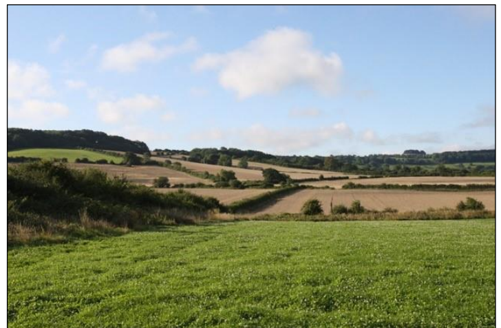
„In dieser Landschaft lässt sich gut pirschen!“