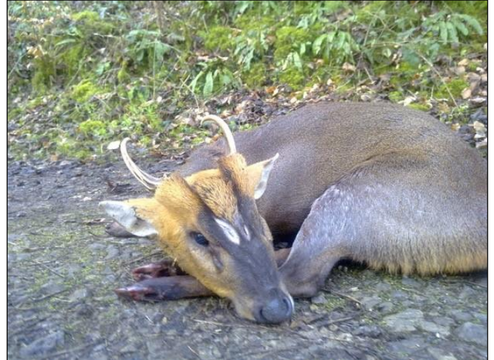
„Der Muntjak – eine große Rarität aus Südostasien!“