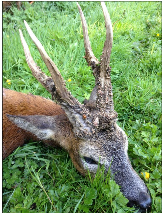
„Hochkapitale Böcke aus dem Südwesten Englands! Jägerträume!“