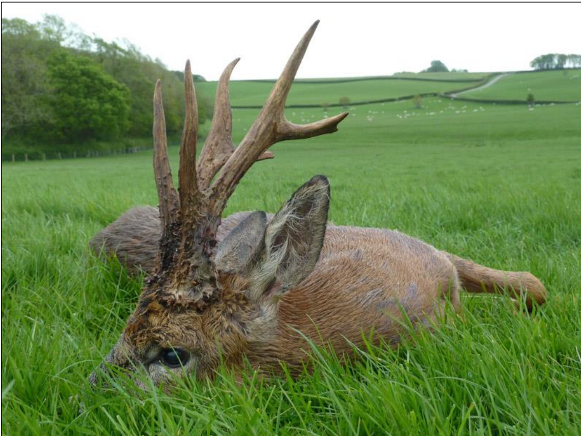
„Ein Lebensbock in typischer Südenglischer Landschaft!“

Der Veranstalter hat über 30 Jahre Jagd- und Wildlifemanagementenerfahrung. Es handelt sich um einen Familienbetrieb, der zusammen mit seinen erfahrenen Jagdführern für zufriedene Jagdgäste und viele Stammkunden sorgt. Er jagt auf privatem Farmland und Estates im südwestlichen Teil des Vereinigten Königreiches. Die Reviere haben eine Gesamtgröße von 50.000 acres.