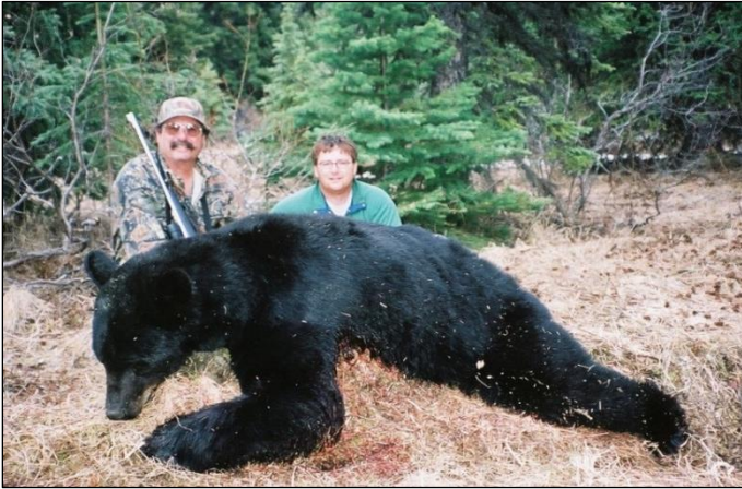
„Prächtiger Schwarzbär aus der Frühjahrsjagd!“