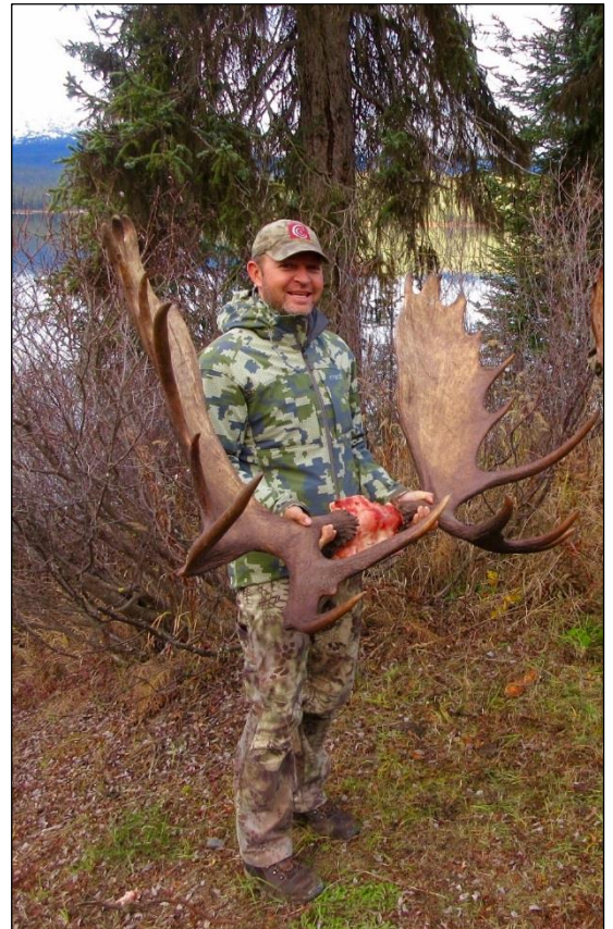
„Stolzer Erleger mit bravem Schaufler!“

Preis- und Programmänderungen vorbehalten!