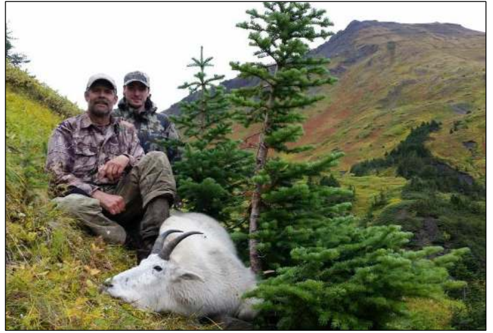
„Die Jagd auf Schneeziege erfordert konditionierte Bergjäger!“