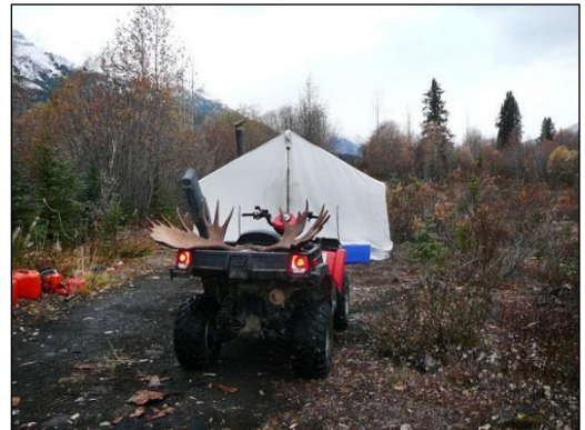
„Trophäe und Wildbret müssen geborgen werden!“