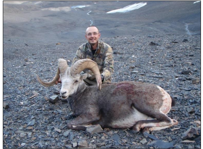
„Zwei der begehrtesten Bergjagdtrophäen Nordamerikas – Schneeziege und Stone Sheep!“