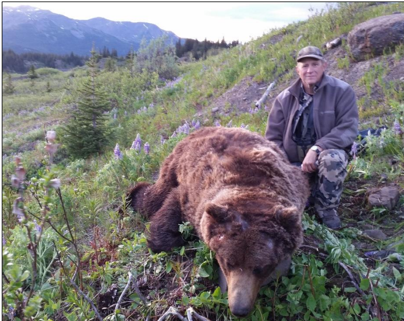
„Kapitaler Grizzly, Einfuhr in die EU leider nicht erlaubt!“