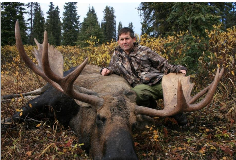
„Die Elchthrophäen unseres Outfitters erreichen im Schnitt 50 – 55 inch, zum Teil auch bis 60 inch!“

Sämtliche sonstigen für die bestätigte Buchung angefallenen Kosten (z. B. Hotelbuchung, Flugarrangement) werden bei Stornierung grundsätzlich in Höhe ihres Anfalls berechnet.