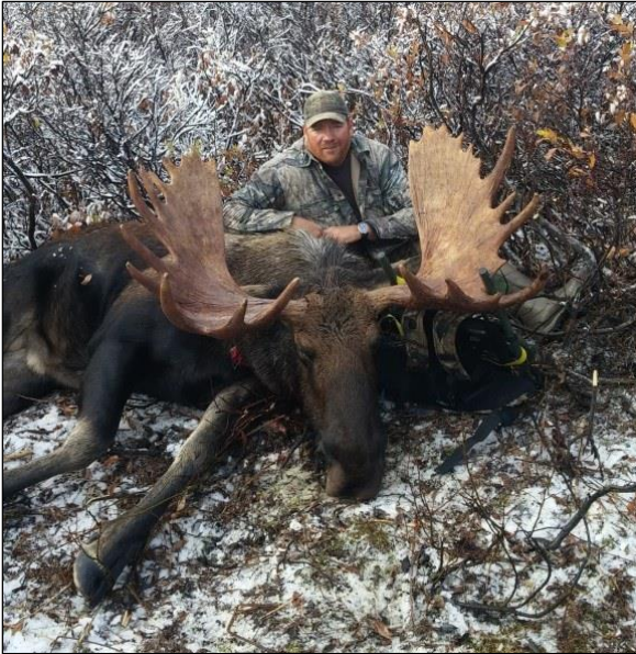
„Bei diesem Jäger ging der Wunsch von einem braven Eichschaufler in Erfüllung!“