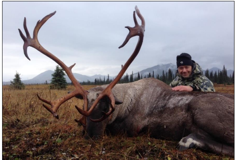
„Zufriedener Jagdgast im Herbst mit seinem Karibu!“