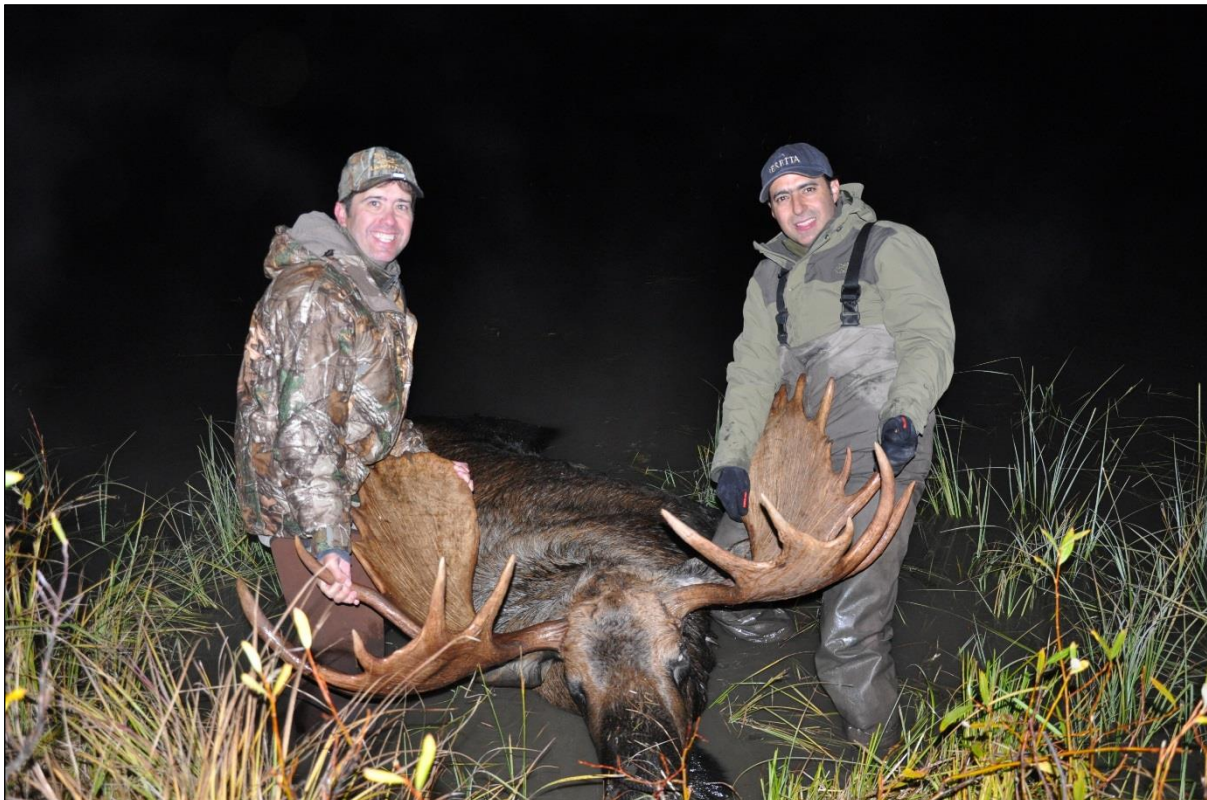
„Im letzten Licht wurde dieser kapitale Schaufler gestreckt!“

Unser Outfitter betreibt ein persönlich geführtes Jagdunternehmen in Nord-Britisch Kolumbien, welches sich etwa 165 Meilen Luftlinie nördlich von Smithers, British Kolumbien befindet. Das Gebiet grenzt an den Spatsizi Wilderness Park und hat eine Größe von ca. 1.200 Quadratmeilen. Im Jagdgebiet befinden sich die Flüsse Skeena, Klappan, Spatsizi und Stikine. Das Revier ist die Heimat zahlreicher Wildarten, von denen acht bejagbar sind: Elch, Mountain-Karibu, Grizzlybär, Schneeziege, Schwarzbär, Stone Sheep, Wolf und Vielfraß.