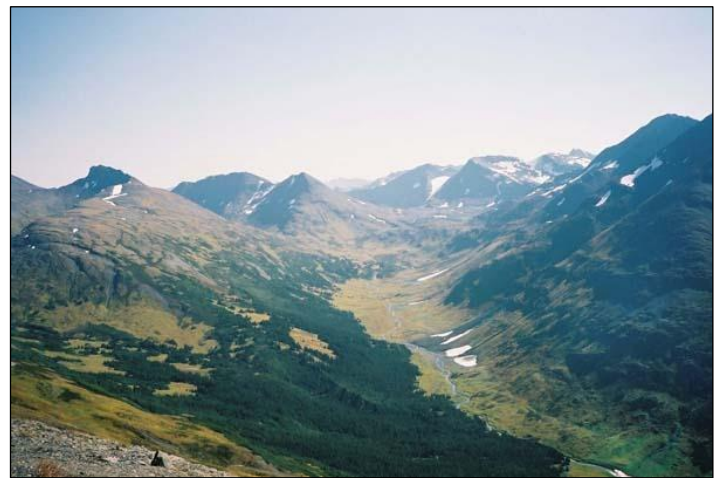
„Das raue Einstandsgebiet der Schneeziege!“