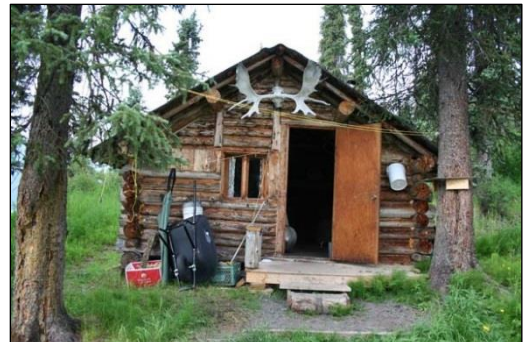
„Urige Jagdhütte im Revier!“