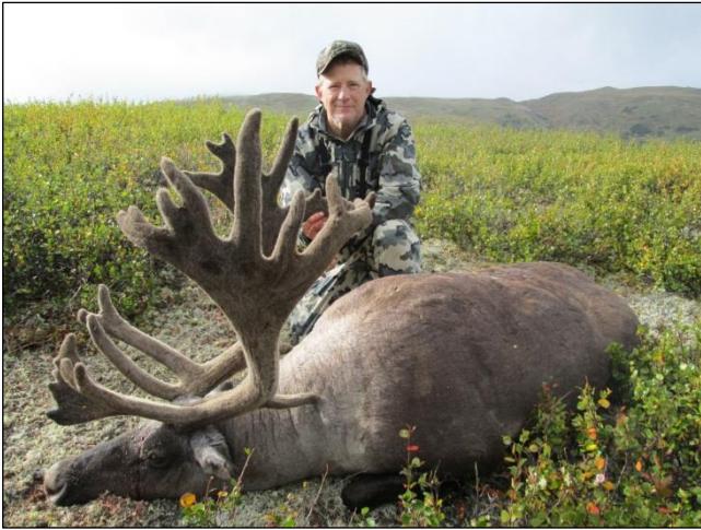
„Mountain Karibu, erlegt am Anfang der Jagdsaison!“

Kein Charterflug erforderlich! 12.900 US$ 9.900 US$ pro Jäger 15.900 US$