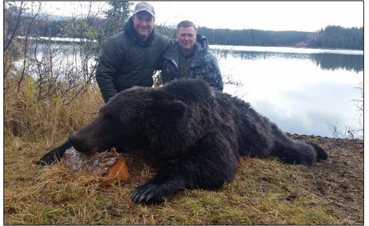
„Der Grizzly ist eine Traumtrophäe Nordamerikas!“