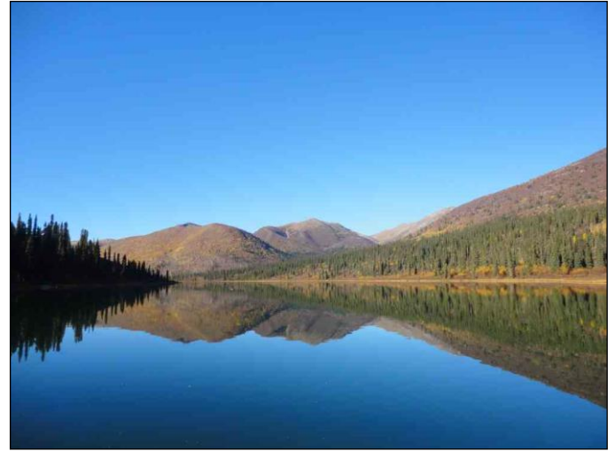
„Dies ist ein ideales Elchbiotop!“