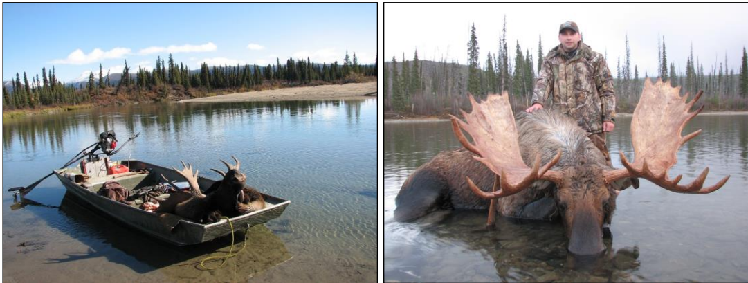
„Die Elchjagd per Boot entlang der Flüsse zur Brunft ist immer sehr erfolgreich!“

Jagdkosten (Boots- oder Pferdejagd) Basis 1 x 1 „all inclusive“ 33.000 US$