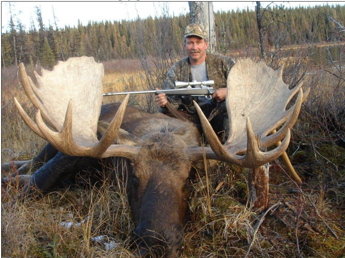
„Dieser kapitale Elchschaufler ließ einen Jägertraum wahr werden!“

Der Name „Yukon“ allein steht schon für kapitale Elchschaufler, starke Bären und für ein unvergessliches Jagderlebnis. Elchbullen mit 60 Inch und mehr sind im Jagdgebiet um den Coal River mit seinen vielen Seen keine Seltenheit. Schafe und Schneeziegen werden in den Logan Mountains und in den Mc Kenzie Mountains, an der Grenze zu den NWT, gejagt.