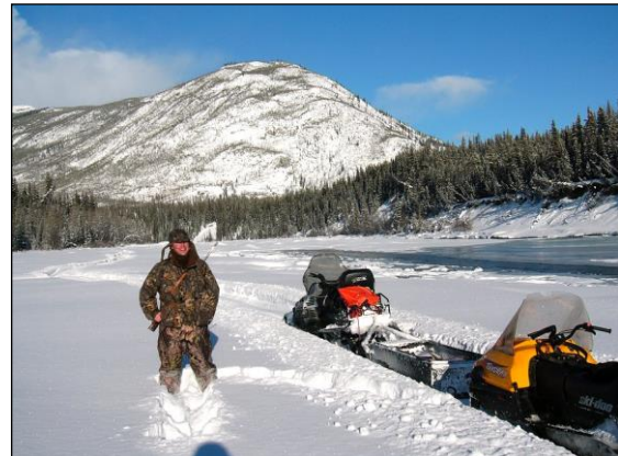
„Winterjagd mit dem Schneemobil!“

Jagdkosten Pferdejagd Basis 1 x 1 „all inclusive“