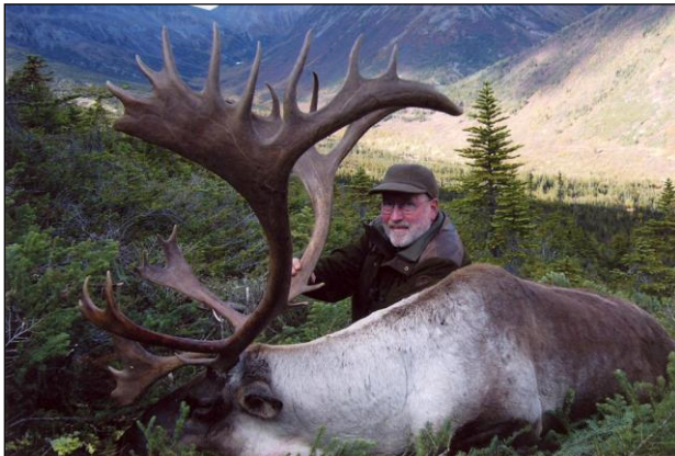
„Mountain Karibu – eine Traumtrophäe!“

Diese Karibuart ist die stärkste Unterart, sowohl von Gewicht als auch Trophäe. Wir erlegen nur alte, starke Bullen, bei denen die Trophäenstärke durchschnittlich 360 B & C-Punkte beträgt. Wir hatten Jahre, in denen der Durchschnitt 390 B & C betrug. Gejagt wird zu Pferd. Es gibt aber auch in einem Gebiet die Möglichkeit mit ATV. Jagdzeit ab 1. August bis Ende September sowie eine „frühe Winterjagd“ (ohne Pferde) im Oktober. Zusätzliche Abschüsse: Grizzly 20.000 US$, Elch 13.000 US$.