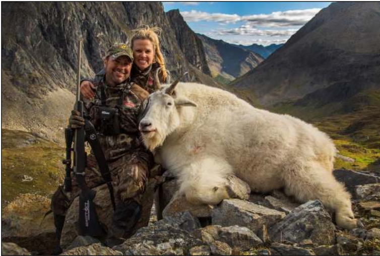
„Nach steilem Aufstieg ist der Erfolg der verdiente Lohn!“