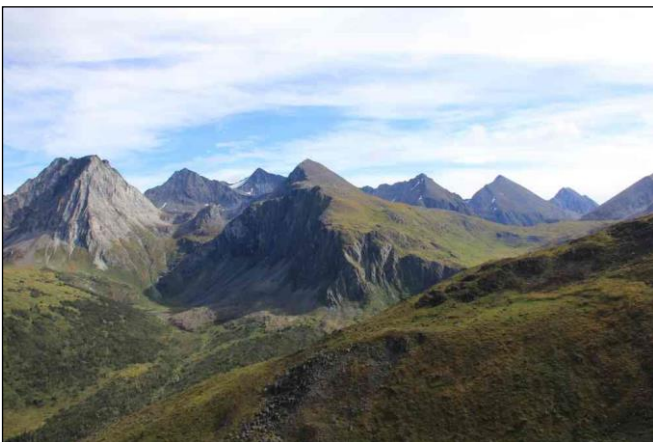
„Einzustand der Dallschafe und Schneeziegen!“

Zusätzliche Abschüsse auf Erfolgsbasis: Elch 13.000 US$, Caribou 13.000 US$, Grizzly 20.000 US$.