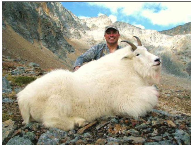
„Die männliche Schneeziege wird auch Billy genannt!“