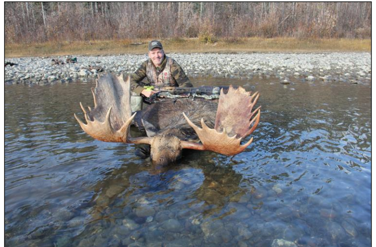
„Der Yukon ist das Elchparadies in Nordamerika!“