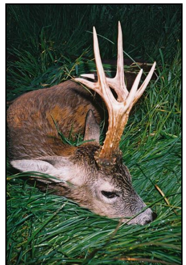
„Deutlich über 500 Gramm!“

Pauschaljagden für Rehböcke auf Anfrage!