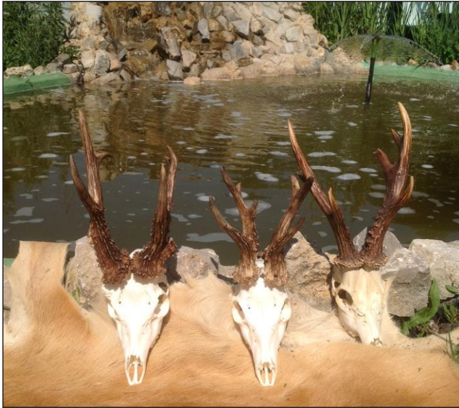
„Erlegt Anfang Juni 2015, 689 g, 459 g und 654 g!“

In der heutigen Zeit muss der Outfitter und Jagdgast immer mehr auf Formalitäten und Bestimmungen über Waffentransport und Trophäeneinfuhr achten. Wir geben Ihnen gerne darüber ausführliche Informationen und bieten Ihnen unseren Transport- und Verzollungsservice an. Es ist sehr wichtig bei der Flugticketbuchung die Waffe anzumelden und bei der Anreise mit dem Auto die Grüne Karte mitzunehmen.