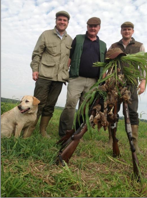
„Wachteljagd mit dem Hund, wie in alten Zeiten!“

inkl. Unterkunft und Vollverpflegung, Jagdkarte, Organisation, Geländewagen im Revier, Pirschführung mit Vorstehhund und Abschuss Wachteln und Tauben ohne Limit.