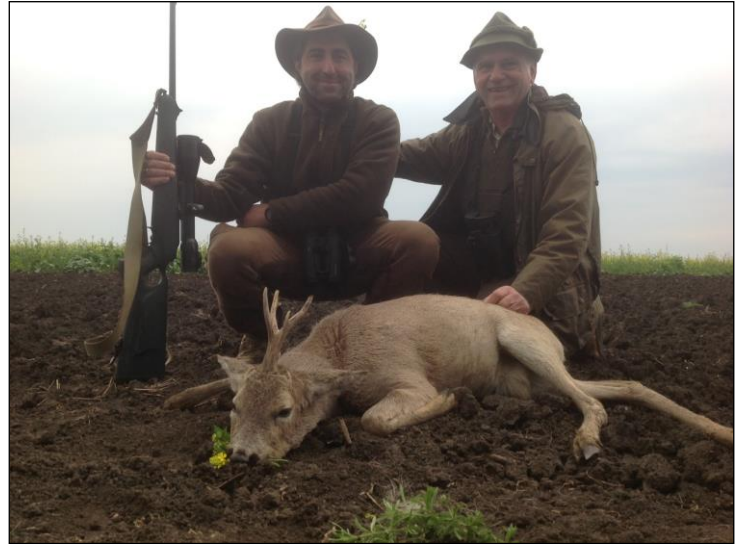
„Hochinteressanter, abnormer Einstangenbock!“