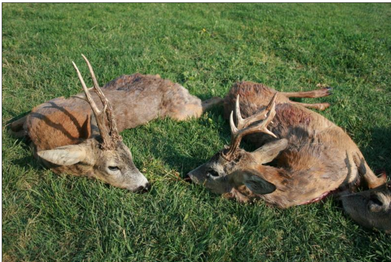
„Die Vojvodina ist berühmt für Ihre kapitalen Rehböcke!“

Serbien ist ein traumhaftes Jagdland. Der nördliche Teil Serbiens, die Vojvodina, ist überwiegend vom Flachland geprägt, während sich in den zentralen und südlichen Teilen Hügel- und Gebirgslandschaften befinden. Serbien hat 55% nutzbaren Boden, wovon 27% Waldflächen sind. Die von uns ausgewählten Jagdreviere weisen einen einzigartigen Wildbestand mit kapitalen Trophäen auf.