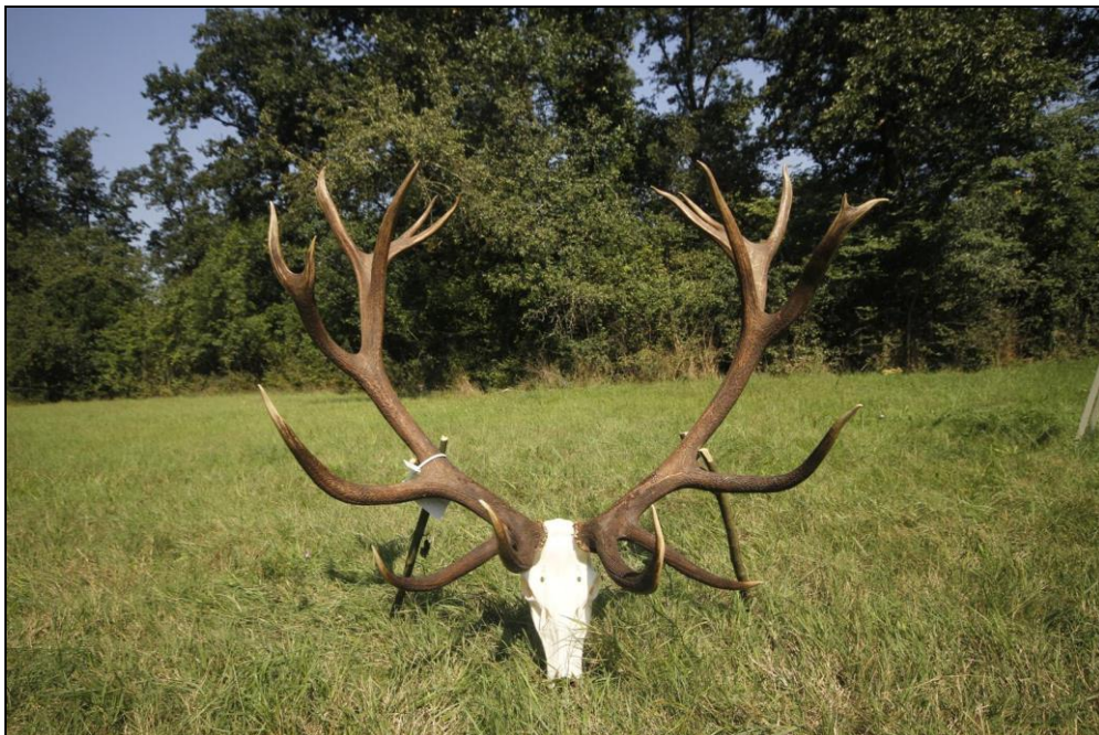
„Reifer Hirsch aus den unberührten Wäldern Serbiens!“