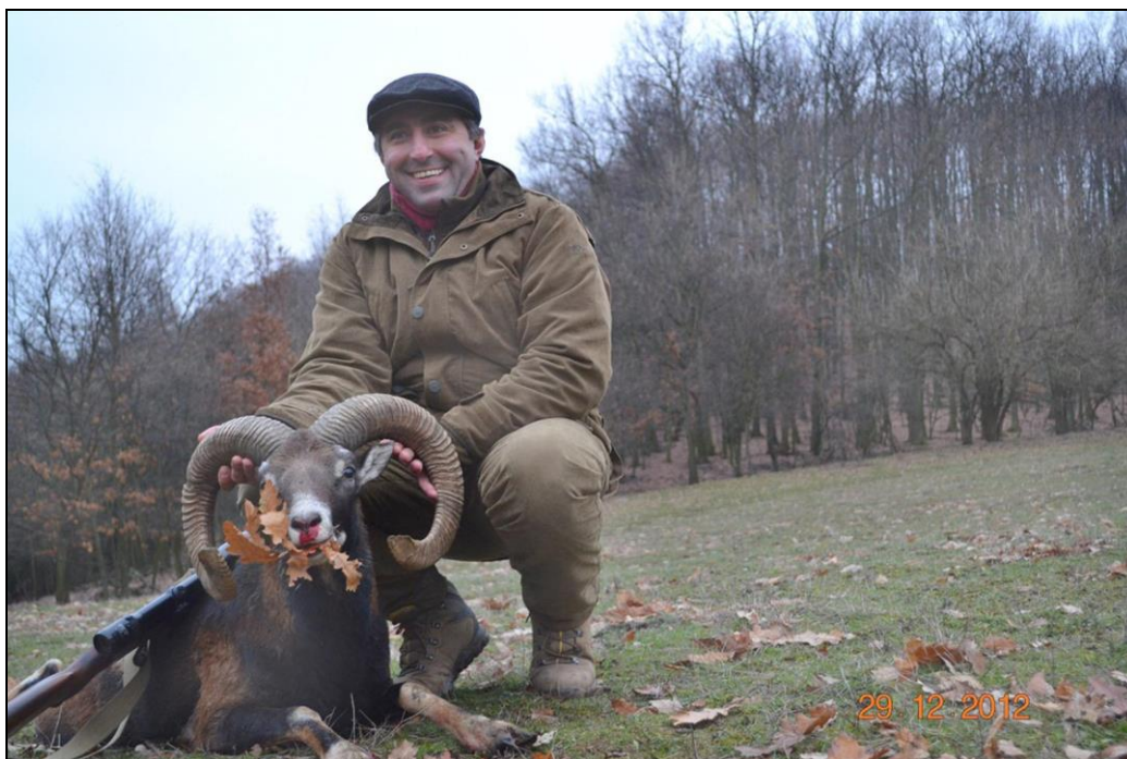
„In Serbien kommen auch gute Muffelwidder vor!“

Muffelschaf 65 € (erlegt und angeschweißt) Muffellamm 40 € (erlegt und angeschweißt)