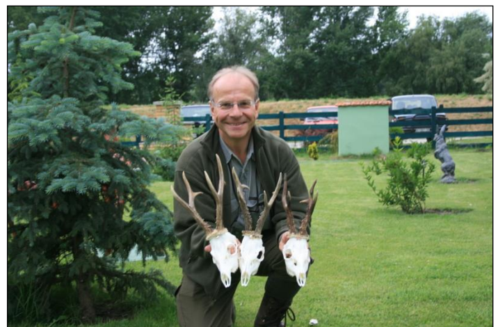
„Glückliche Erleger mit Ihren Böcken aus der Vojvodina!“