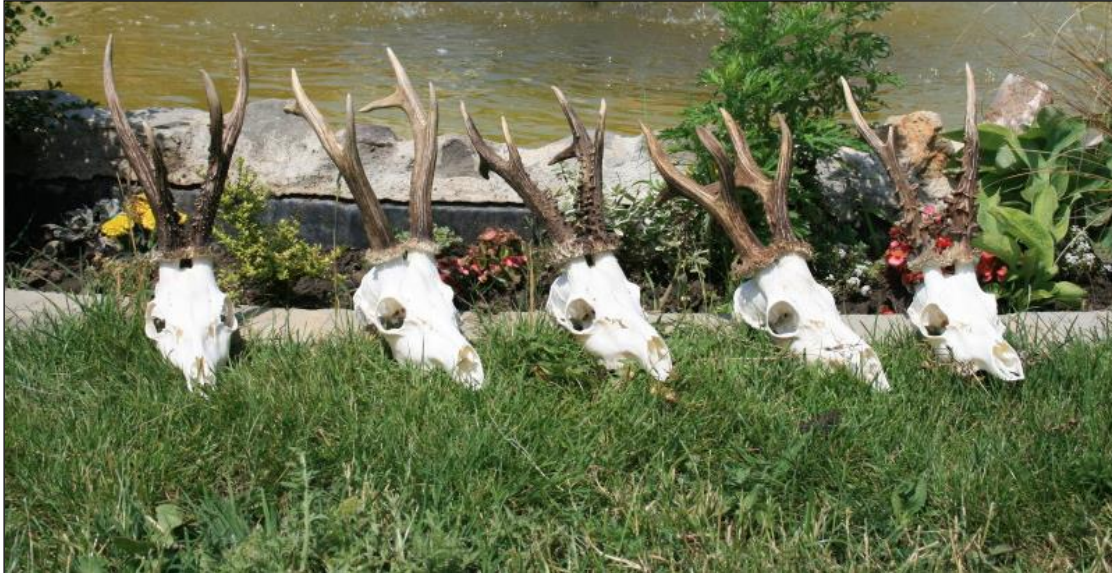
„Fünf brave, stolze Böcke in drei Tagen – bereit für die Abreise!“

Bei der Abrechnung/Bewertung der Trophäe muss der Jagdgast eine Abweichung von +/- 15 % der gebuchten Trophäenstärke (Größe in cm, Punkte, g/kg, etc.) akzeptieren. Die Trophäen bleiben bis zur vollständigen Bezahlung der Schlussrechnung Eigentum des Veranstalters/Reviere.