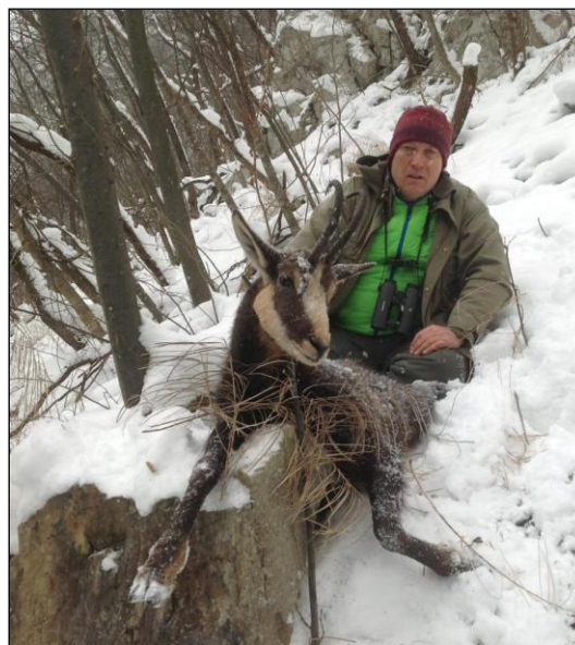
„Die Gamsbrunft im November ist immer ein Erlebnis!“