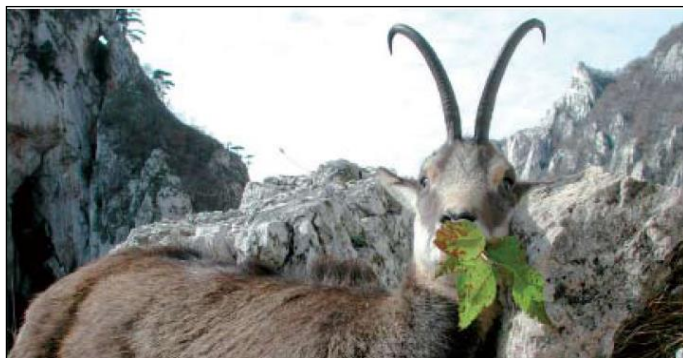
„Spitzen Gamsgeiß aus Mazedonien, 14 Jahre alt!“