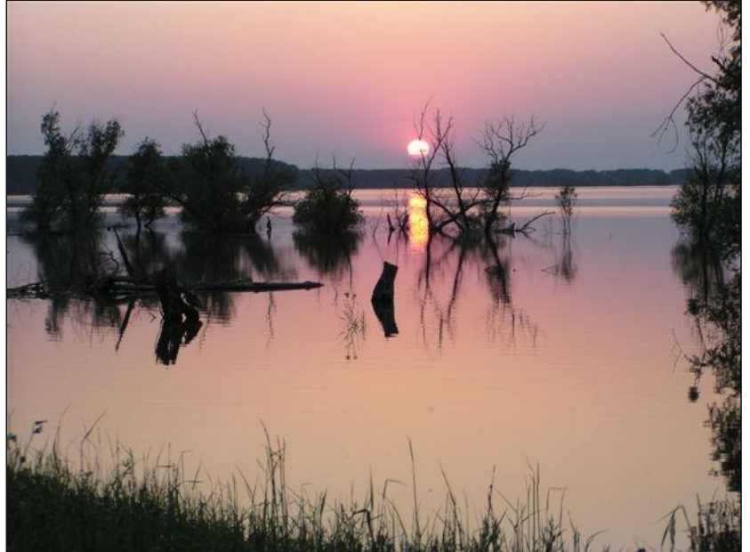
„Sonnenuntergang in der Vojvodina!“