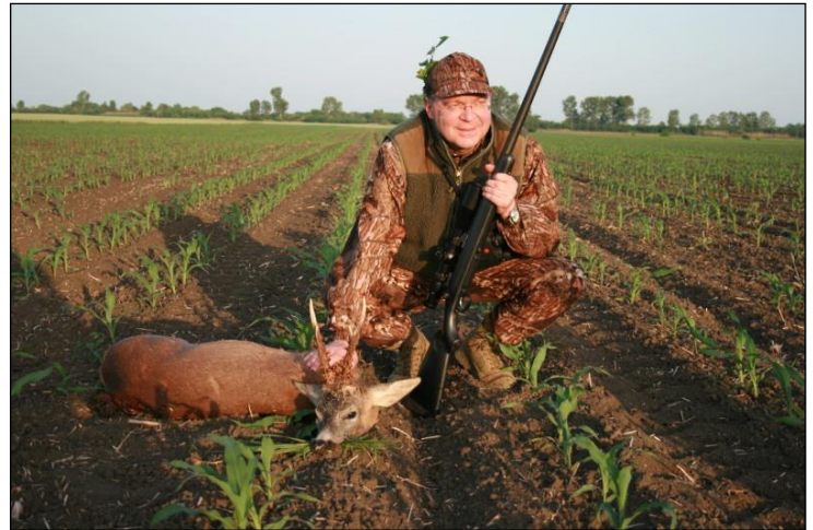
„Endlose Weiten in der ehemaligen Kornkammer Jugoslawiens!“