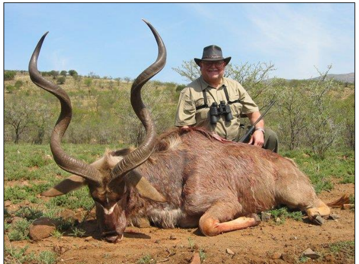
„Wirklich starker Kudubulle gestreckt nach spannender Pirsch!“