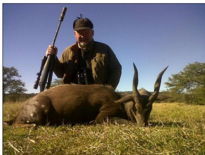
„Die Ost-Kap-Buschböcke sind etwas dunkler gefärbt!“