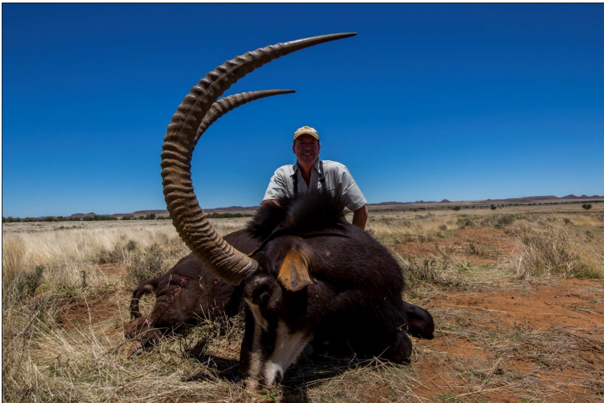
„Zufriedener Jagdgast mit seiner Rappenantilope!“

Willkommen bei unserem südafrikanischen Veranstalter, wo Jägerträume wahr werden! Für viele Jäger ist eine Safari in Afrika die Reise ihres Lebens. Unser Outfitter betreibt drei Hauptjagdgebiete: Karoo, Coastal und Mountain Konzession. Das Jagdgebiet Karoo umfasst 50.000 ha und ist nicht durch Zwischenzäune abgetrennt! Es handelt sich hier um eines der größten privaten Jagdgebiete Südafrikas – Jagd wie in freier Wildbahn!