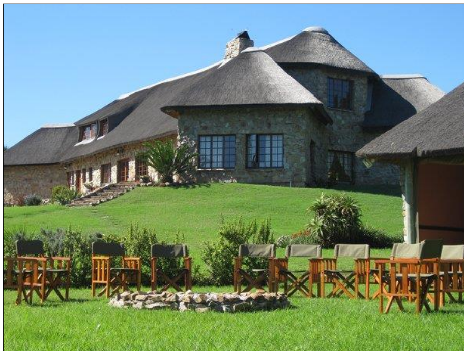
„River Busch Lodge: Großartige Lodge, Verpflegung, Weine, perfekter Service und Gastfreundschaft!“