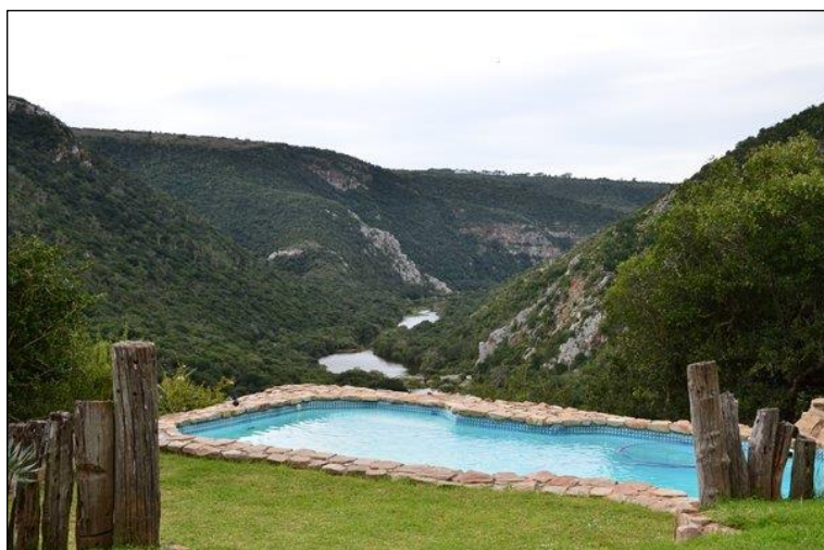
„Swimmingpool mit sensationellem Ausblick!“