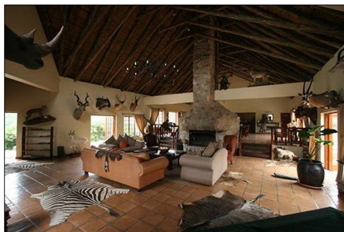
„In diesem tollen Ambiente schmeckt der Sundowner!“