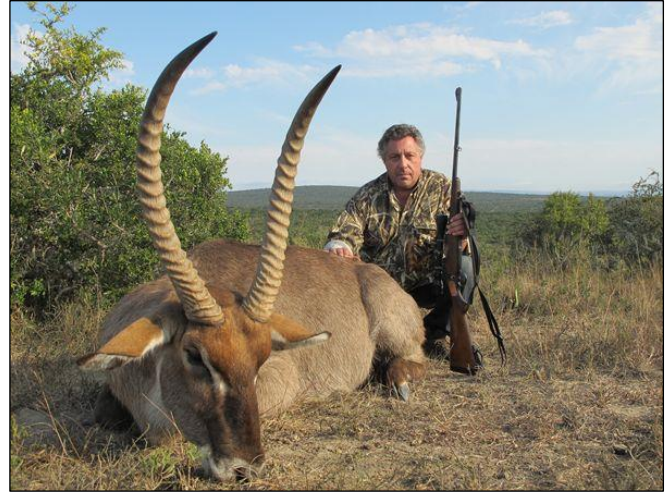
„Der Wasserbock ist eine typische Wildart Südafrikas!“