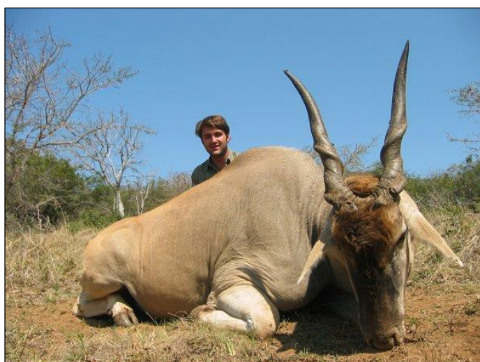
„Tonnenschwerer Elandbulle mit jungem Jäger!“