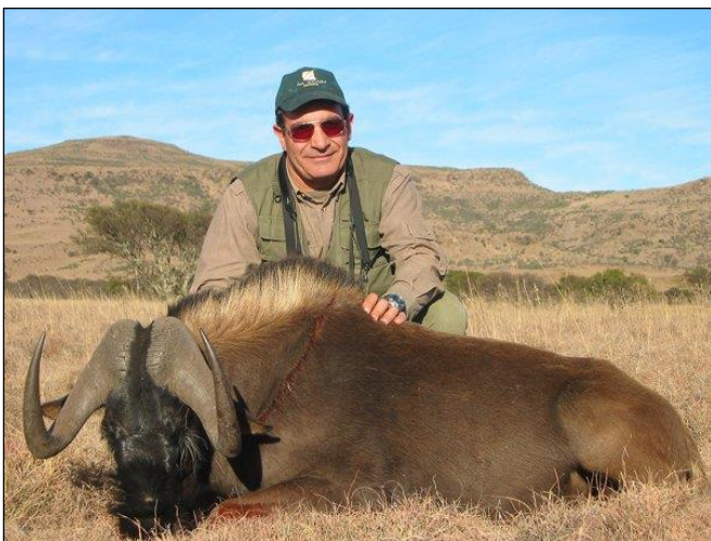
„Weißschwanzgnu in den Weiten des East Cape!“

Bei anderen Wildarten, die nicht aufgelistet sind, ist der Preis auf Anfrage. Sämtliches angeschweißtes Wild gilt als erlegt und muss voll bezahlt werden.