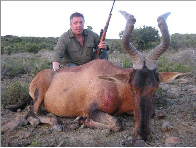
„Red Hartebeest mit sauberem Blattschuss erlegt!“