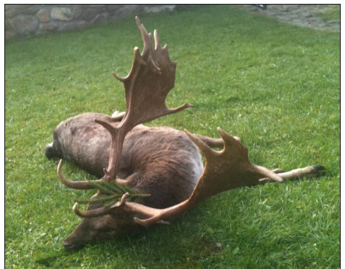
„Die Damhirsche erreichen hier eine beachtliche Trophäenstärke!“

Preis- und Programmänderung vorbehalten!