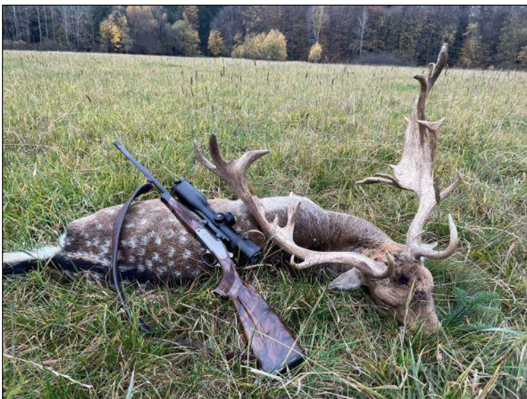
„Brave Damschäufler mit 4,12 kg und 3,34 kg!“