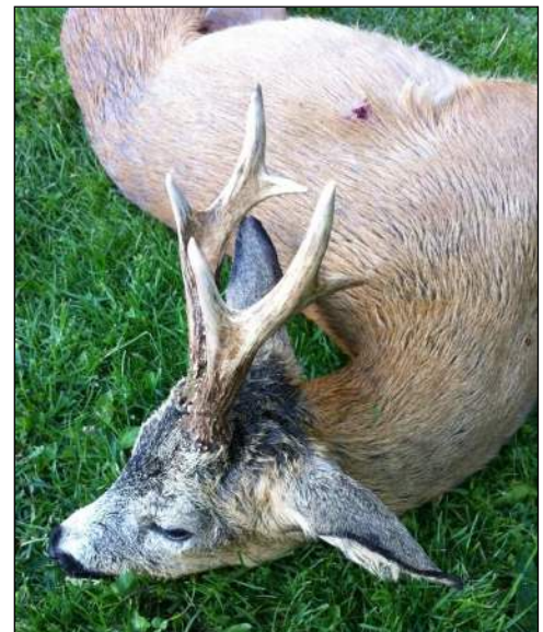
„Brave Böcke waidgerecht zur Strecke gelegt!“