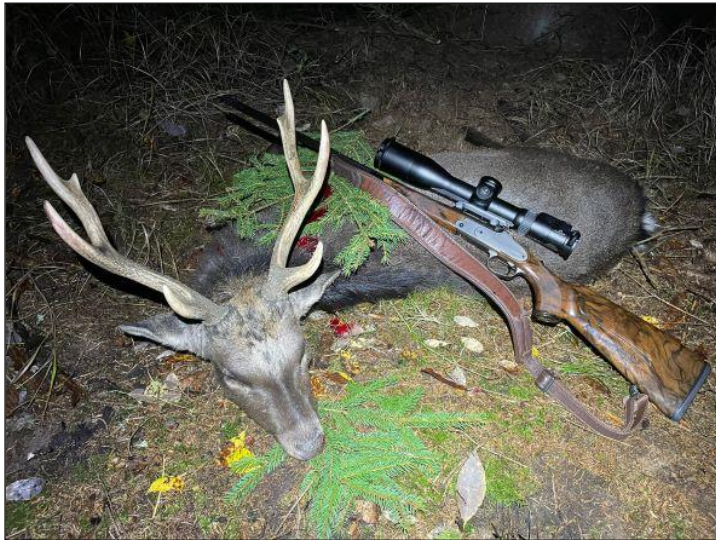
„Die Sikahirsche werden in einem Revier Nähe Marienbad in freier Wildbahn bejagt!“ (Foto rechts: Achtender-Silber-Medaille)