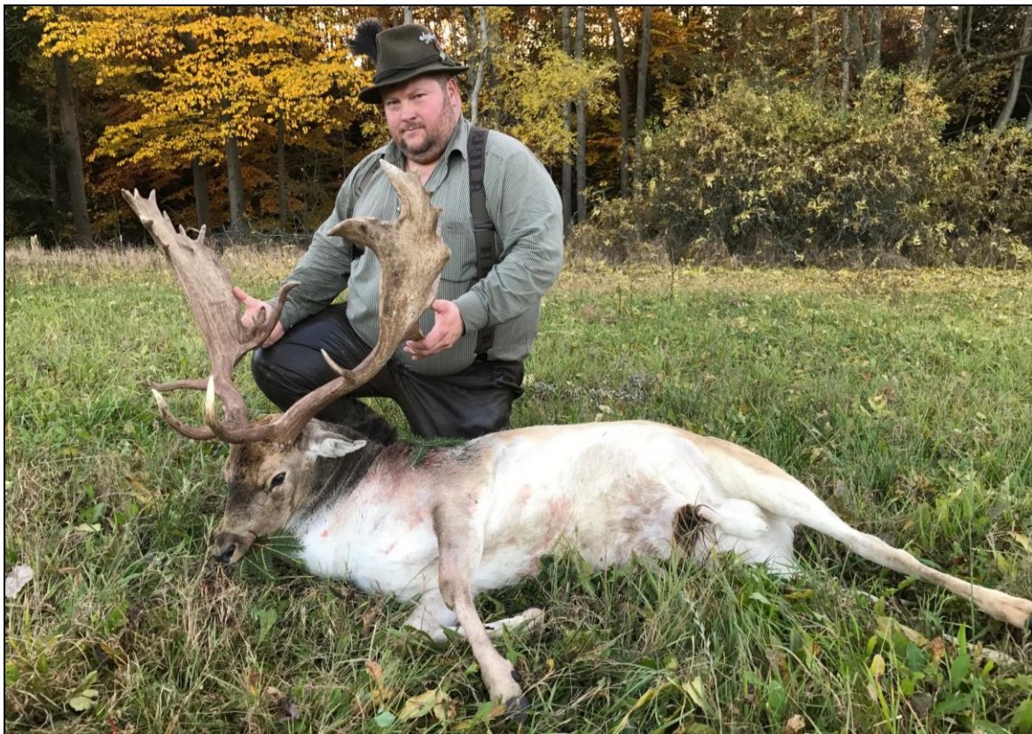
„Kapitaler Schaufler bei bestem Brunftwetter im Oktober erlegt!“