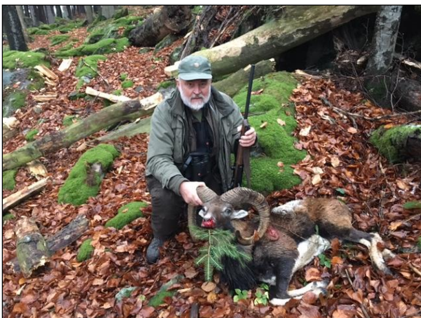
„Starker Widder auf der Morgenpirsch erlegt!“

Brunftzeit ca. 1. Juli bis 31. Januar 5. Oktober bis 5. November