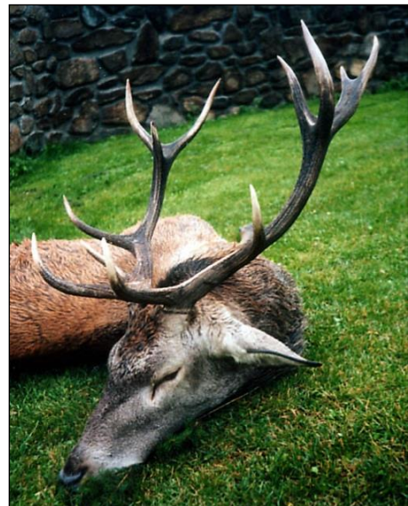
„Typischer tschechischer Abschusshirsch!“