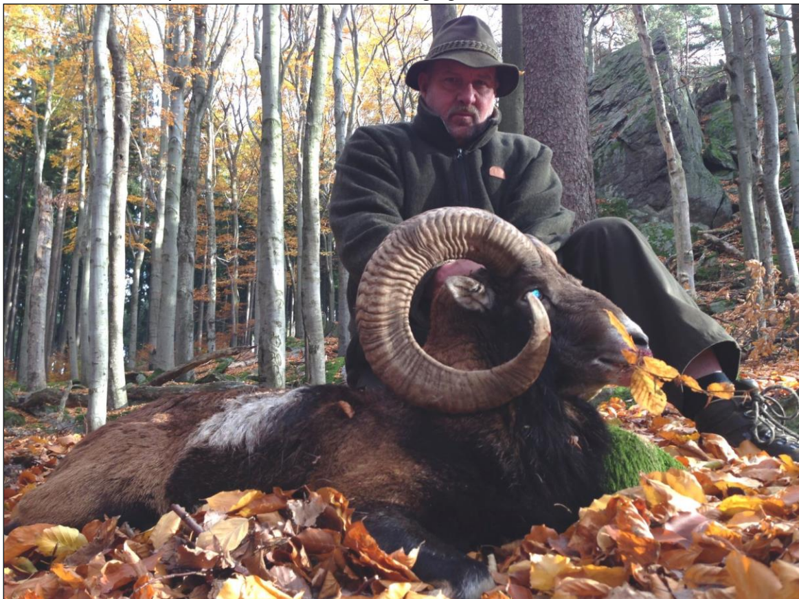
„Hier hat sich ein Jägertraum, im goldenen Herbst, erfüllt!“

Unseren Veranstalter freut es sehr, dass Sie Interesse an der Jagd in der Tschechischen Republik haben. Er geht gerne auf Ihre Wünsche ein und organisiert eine Jagd für Sie und Ihre Jagdfreunde. Der Sitz unseres Partners befindet sich in der kleinen Stadt Klatovy, Nähe der deutschen Grenze - 40 km nördlich vom Grenzübergang Bayerisch Eisenstein. Der Geschäftsführer dort veranstaltet die Jagd in der Tschechischen Republik für ausländische Jagdgäste seit 1991.