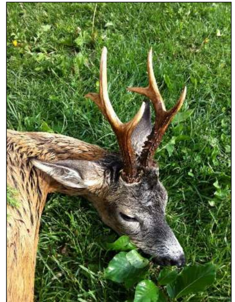
„Hoher Sechser aus dem Böhmerwald!“