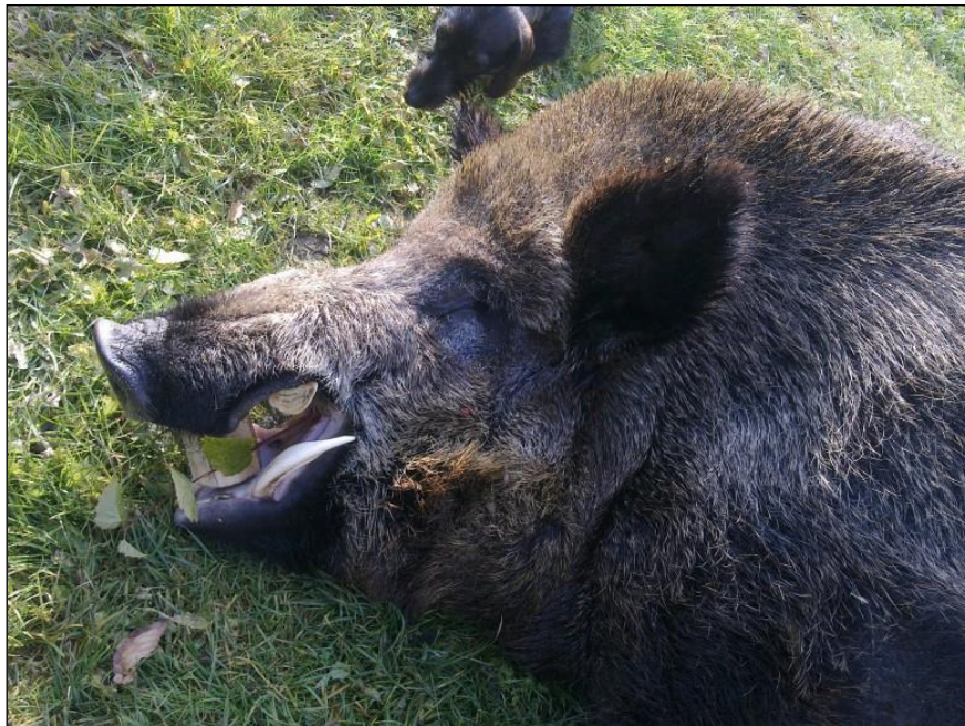
„Reifer Basse mit 24,5 cm Waffenlänge!“