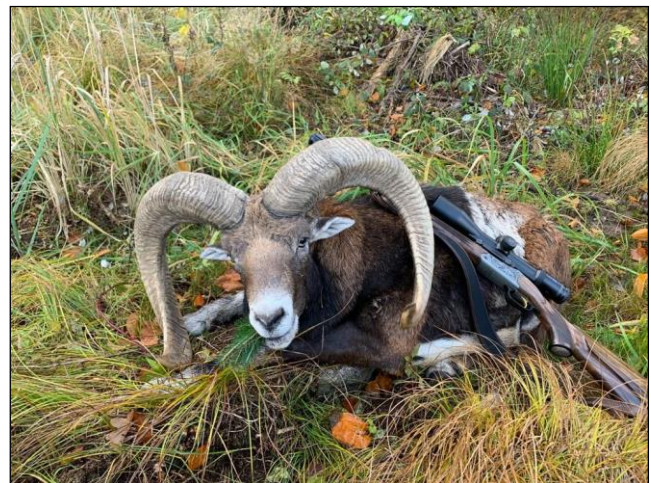
„Zwei reife Widder mit 98,75 cm und 88,25 cm!“

Angeschweißtes Wild wird mit 50 % der vom Jagdführer geschätzten Trophäenstärke berechnet. Die Länge der Schnecken wird an den Außenseiten der Biegung gemessen.