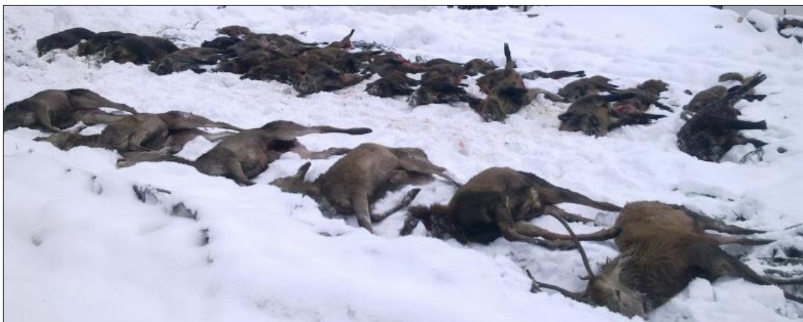
„Gemischte Hochwildstrecke nach einem erlebnisreichen Drückjagtag!“

Sollte versehentlich etwas anderes als angeboten geschossen werden, wird es nach Preisliste bezahlt.