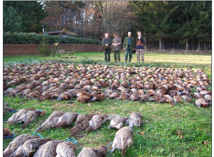
„Von solchen Strecken kann man in Deutschland nur noch träumen!“