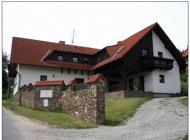
„Gemütliches Jagdhaus im Revier!“