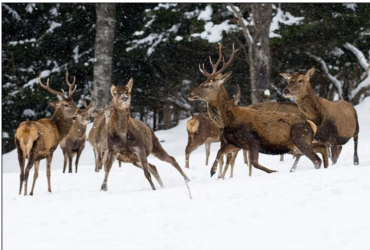
„Winterstimmung im Rotwildrevier!“