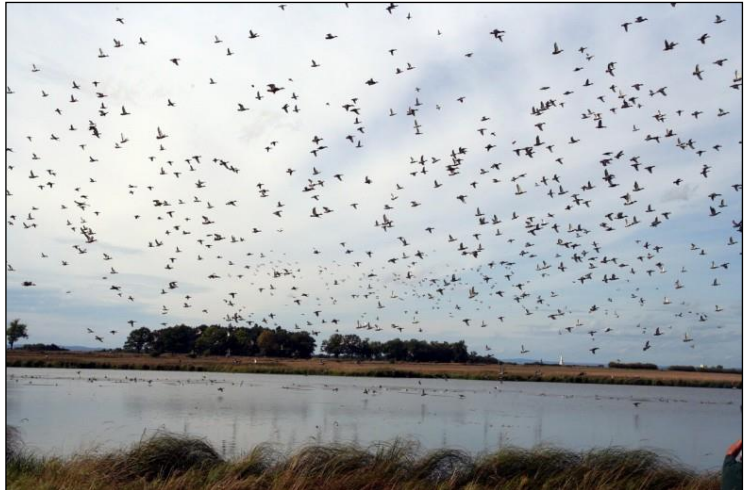
„Getriebene Enten sind eine Spezialität für den passionierten Flintenschützen!“