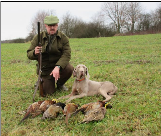
„Buschierjagd auf Fasan mit dem eigenen Vorstehhund!“