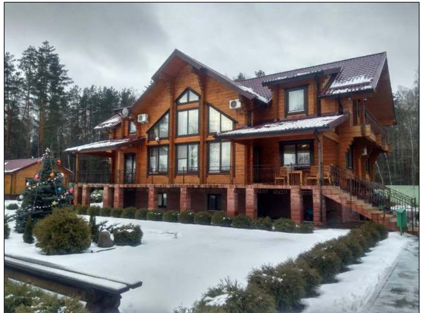
„Das Jagdhaus befindet sich mitten im Revier!“

Preis- und Programmänderungen vorbehalten