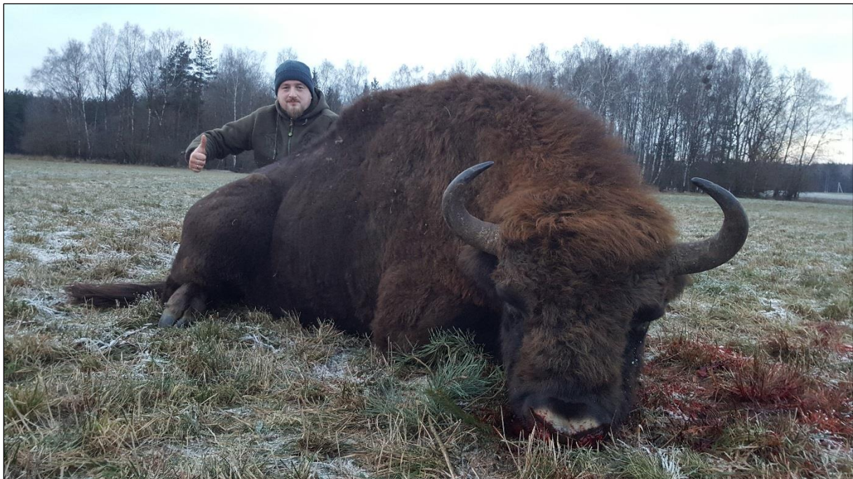
„Gold Med. Wisentbulle erlegt von einem unserer Stammkunden!“

Die Unterkunft im Jagdhaus befindet sich im Revier „Osipowiczi“.